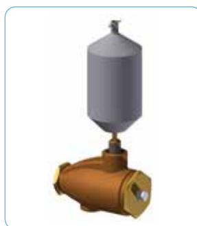
SA603D externer Ablassautomat