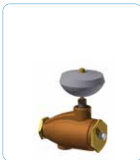
SA602D externer Ablassautomat